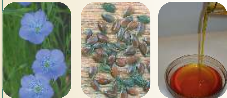
Fra plante til olje

1) Ren linolje , presset av frø fra linplanten. Linolje er et rent naturprodukt, fornybart og fullstendig fritt for skadelige avgasser. Linoljen trekker inn i treverket og konserverer/ beskytter mot vanninntrenging og råte!