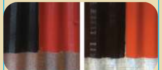
2 strøk Linomal rett på rustetbølgeblekk. Farge Sort og Rød.