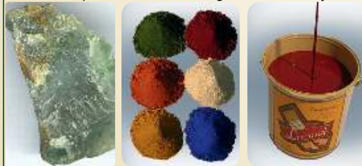
Fra mineral til maling

Dette er de sterkeste og mest lysekte pigmentene som er å få. Derfor blekner ikke ekte linoljemaling så fort som moderne maling gjør. I tillegg beskytter disse pigmentene mot mekanisk nedbryting fra nedbør og sol, og gir overflaten en fin patina selv etter mange års værslitasje!