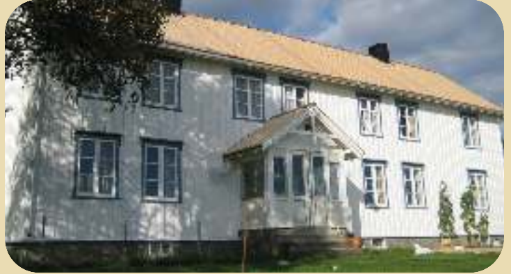
Staselig Trønderlån i Beitstad (Illustrasjonsbilde)