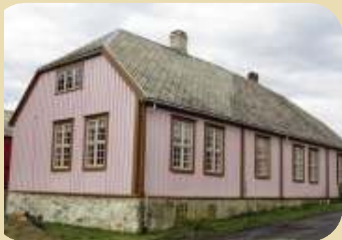
Granåsen gård i Trondheim 2014. Tilbakeført til originale rokokkofarger fra da gården ble ferdigstilt i 1770. Linomal linoljemaling fra Møretyri. Hovedfarge NCS 2005-30R. Staffasje NCS 5020-Y30R