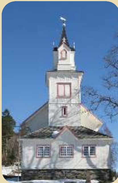
Asskard kirke på Nordmøre. Hovedfarge hvit, staffasje gammelrosa

Linomal® Linoljemaling fra Møretyri kan også brukes på tak av stein, stål og aluminium som vist nedenfor.