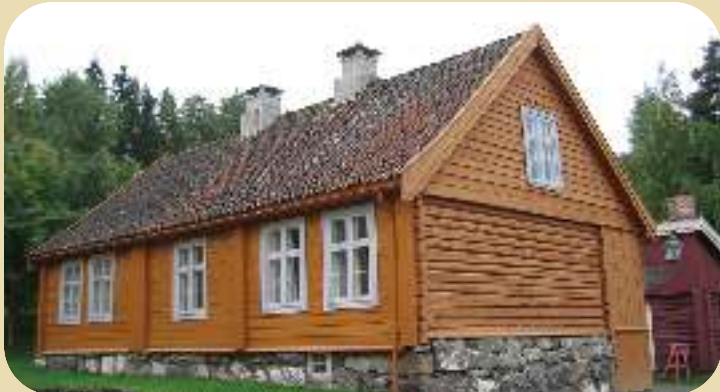
Fra Maihaugen (Illustrasjonsbilde)