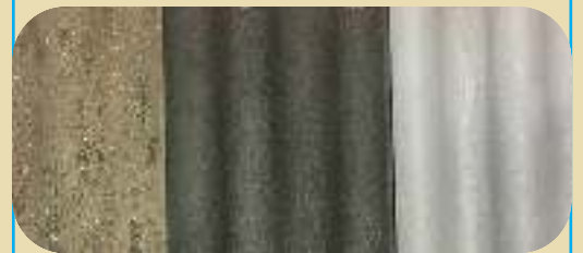
Værslitt takstein malt med 2 strøk av henholdsvis Svart og Grå

Linomal® Linoljemaling fra Møretyri kan også brukes på tak av stein, stål og aluminium som vist nedenfor.