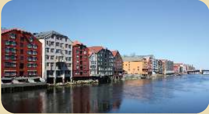
Bryggerekke ved Nidelven i Trondheim (Illustrasjonsbilde)

Ekte linoljemaling egner seg godt på alle bygningstyper av tre. Bildene under viser eksempler på slike bygninger.