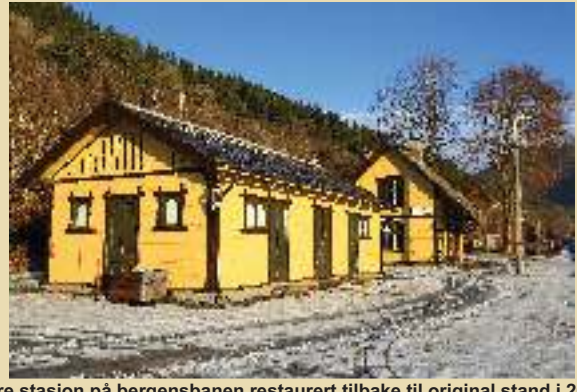
Ygre stasjon på bergensbanen restaurert tilbake til original stand i 2016. Linomal linoljemaling fra Møretyri AS. Hovedfarge NCS 2030-Y10R, dørene i Furugrønn og omramming NCS 8006-Y63R